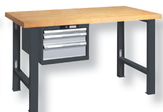
NCS S 6502-B grau metallic/ RAL 7035 lichtgrau