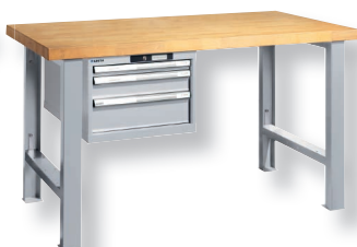
RAL 7035 lichtgrau