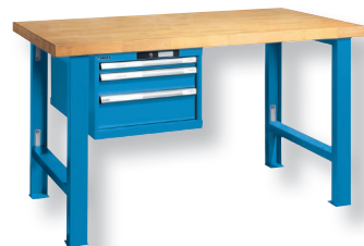
RAL 5012 lichtblau