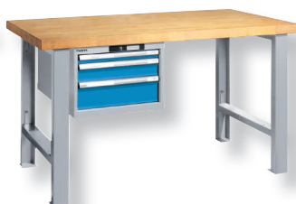
RAL 7035 lichtgrau/ RAL 5012 lichtblau