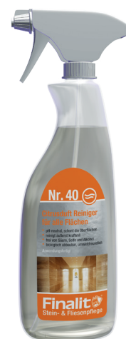
0,5L Sprühflasche (anwendungsfertig)